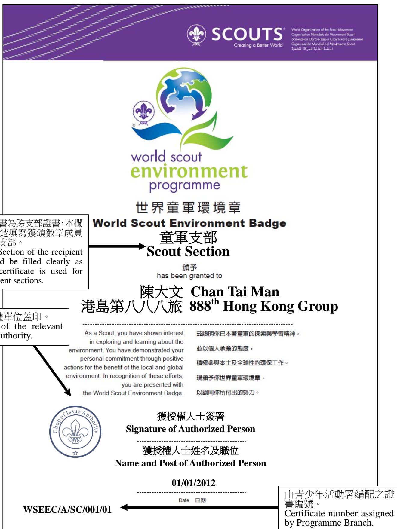
圖十：「世界童軍環境章證書」式樣