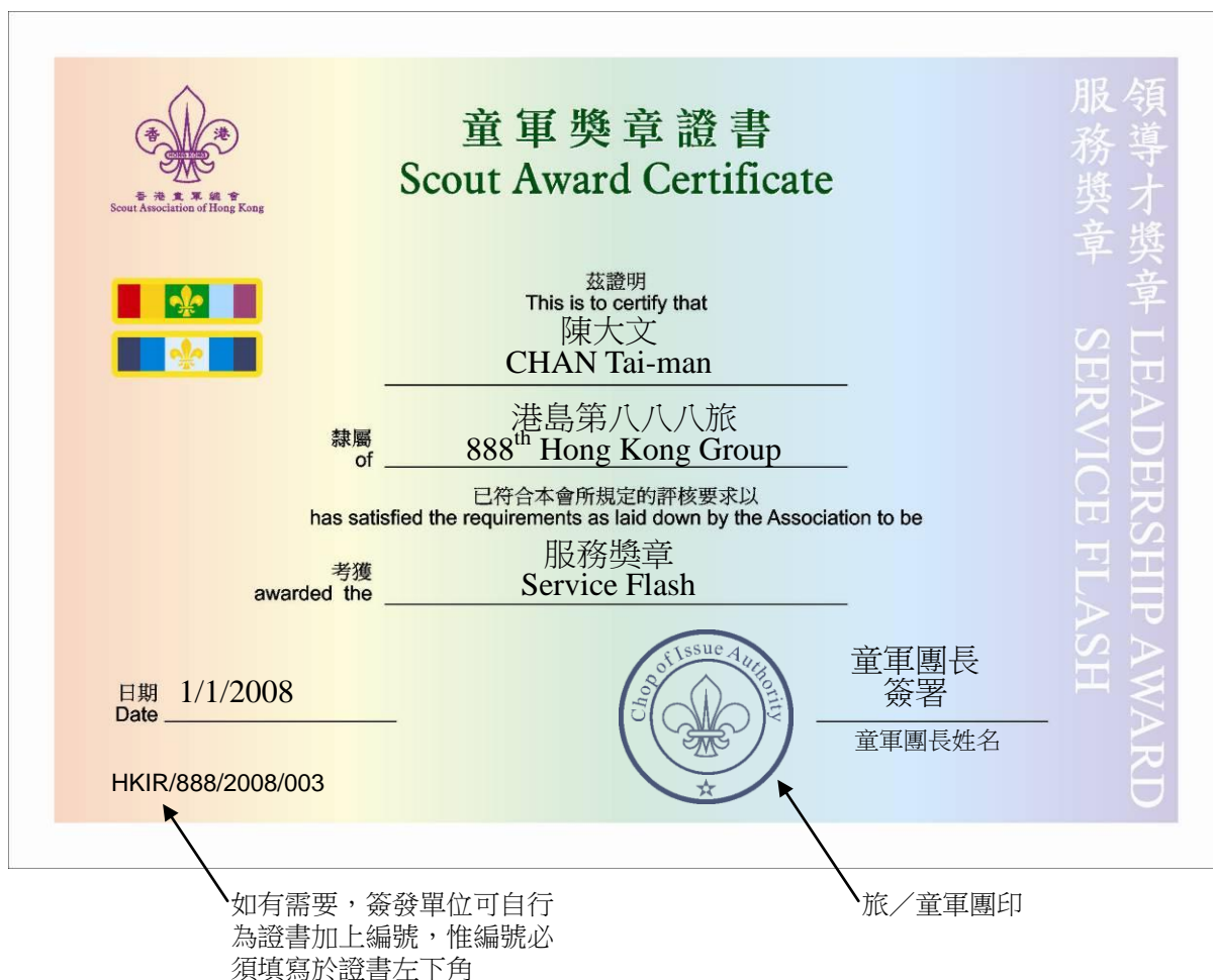
圖四：「童軍獎章證書」式樣