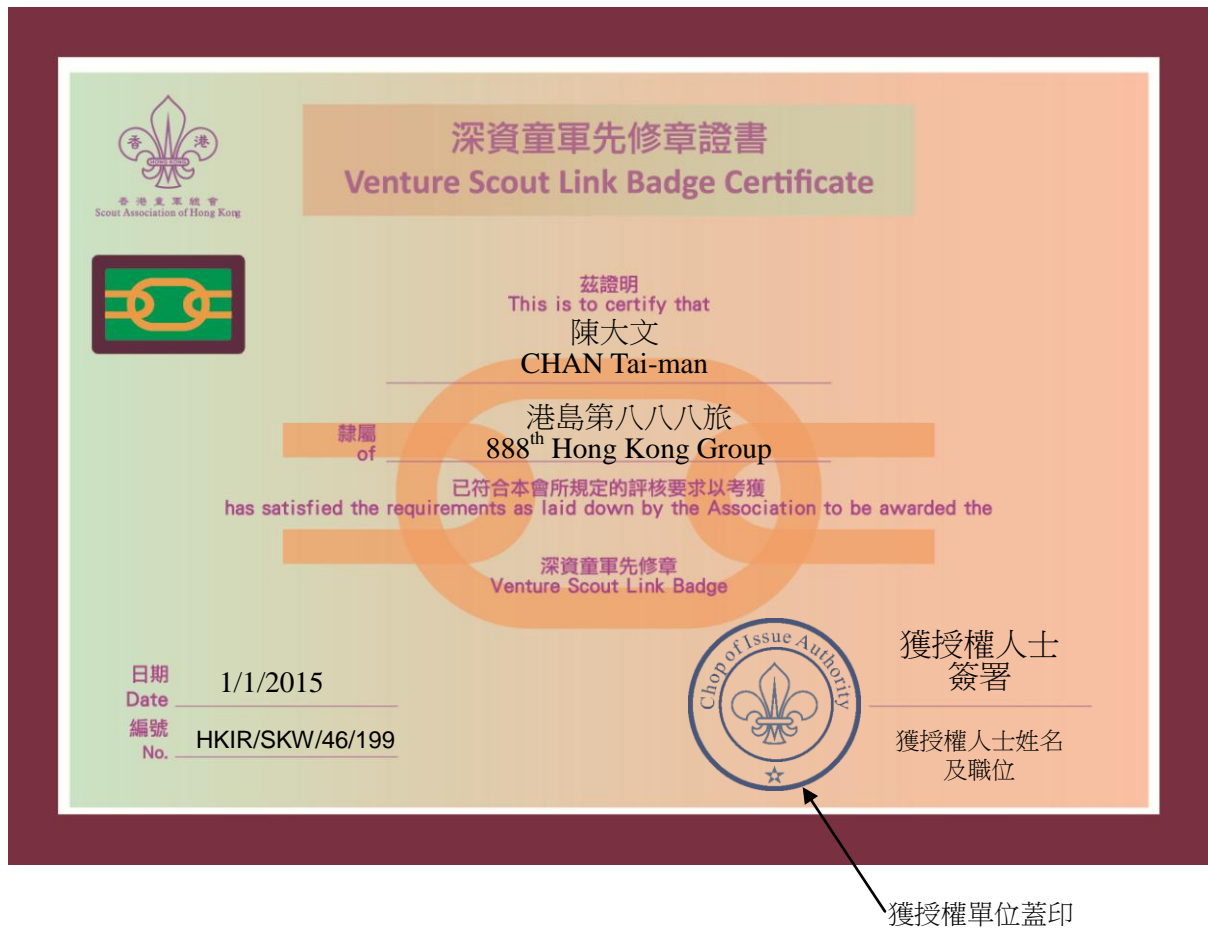
圖七：「深資童軍先修章證書」式樣