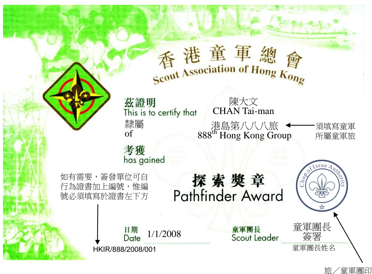
圖一：「探索獎章證書」式樣